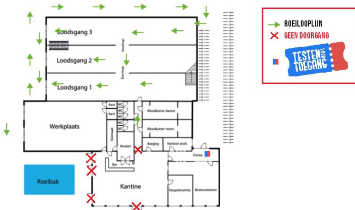
Figuur 2: looplijnen roeiers